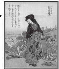
繪本百物語「飛縁魔」挿絵 竹原春泉(一八四一年)

顔さうさううさうさうさう かたさうさうさうさうさう さうさうの精血を吸つおふえ さうさうさうさう