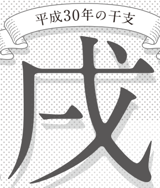
戌戌(つちのえいぬ)